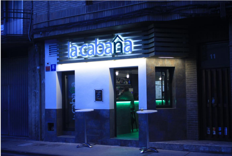
Foto de la fachada final después de la rehabilitación.