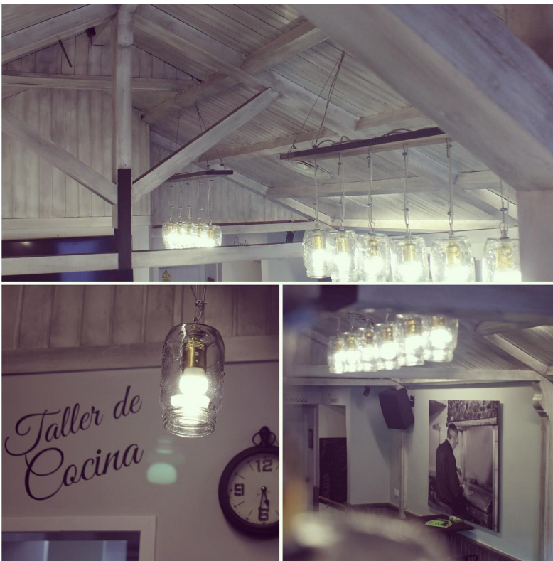
Foto de detalles decorativos y la restauración del techo y el friso de madera.