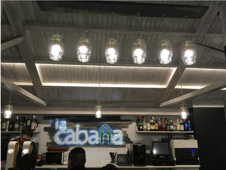
Foto barra interior con logotipo y distribución final.